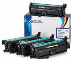
Toner Katun per uso in HP serie 3525/3530 37480 (K), 37481 (C), 37482 (M), 37483 (Y)