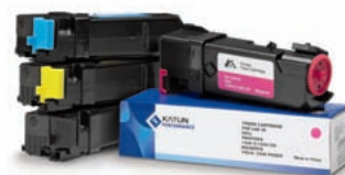
Toner Katun per uso in Dell 1320C 37696 (K), 37697 (C), 37698 (M), 37699 (Y)