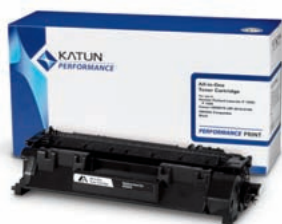
Toner Katun per uso in HP 2035/2055 37484 (A), 37485 (X)