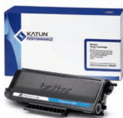
Toner Katun per uso in Brother serie DCP 8080/HL 5340/MFC 8480 37581