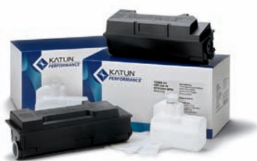
Toner Katun per uso in Kyocera Mita serie FS 2020/3920/4020 37345 (12k); 37346 (15k); 37347 (20k)