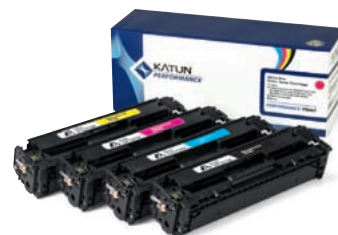
Toner Katun per uso in HP serie 2025/2320 37409 (K), 37410 (C), 37411 (M), 37412 (Y)